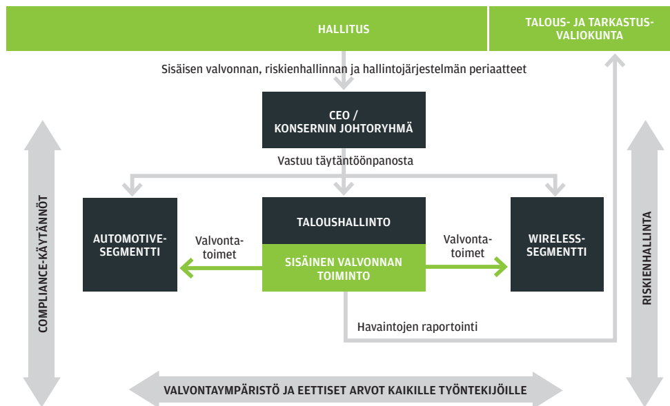
EB:n sisäisen valvonnan viitekehysten avainalueet 2010.